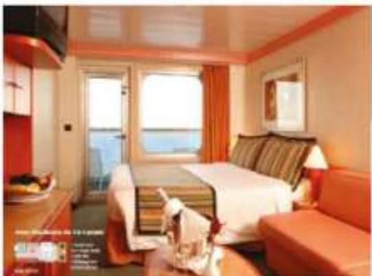
BALCONY : 2 – 4 Pax

17.7 m 2 [190.52 ft 2 ] 1 DBL bed [or 2 SGL beds] 1 foldaway bed Permanently closed window