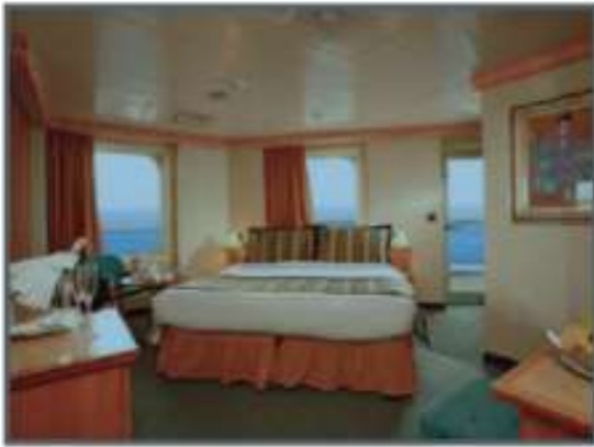
Mini Suite : 2 Pax