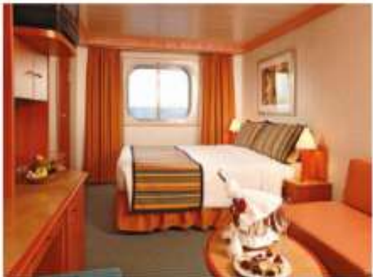
OUTSIDE : 2 – 4 Pax

13.9 m 2 [149.6 ft 2 ] 1 DBL bed [or 2 SGL beds] 2 foldaway beds