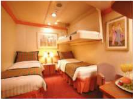
INSIDE : 2 – 4 Pax