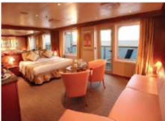
Grand Suite : 2 – 4 Pax

31.3 m 2 [336.91 ft 2 ] 1 DBL bed [or 2 SGL beds] 1 Sofa bed Grande Private Balcony Dressing room Bathroom, Jacuzzi