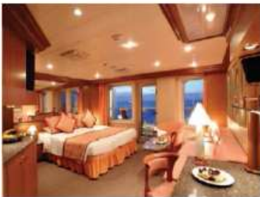
Suite : 2 – 3 Pax

48.3 m 2 [519.89 ft 2 ] 1 DBL bed [or 2 SGL beds] Grande Private Balcony Dressing room Bathroom, Jacuzzi