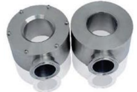
Ring Air Knife