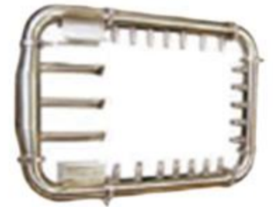
Round Air Knife