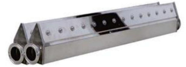
Stainless Steel Air Knife