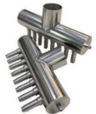
Jet Air Mount