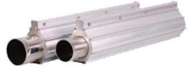
Aluminum Air Knife

Air Knife Blower มีหลายขนาดให้เลือก ตั้งแต่ 150mm ถึง 2500mm Inlet Air มีขนาด 2" , 3" , 4" วัสดุมีทั้ง Aluminum และ Stainless Steel สามารถสั่งทำพิเศษได้ตามขนาด และรูปแบบที่ใช้งาน