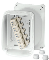
DK 1616 G