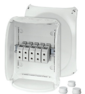
DK 3535 G