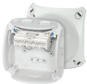
DK 0202 G

With elastic membrane terminal with 2 clamping units per pole rated insulation voltage: U_i = 690 \text{ V a.c./d.c.} material: PP (polypropylene) Colour: grey, RAL 7035